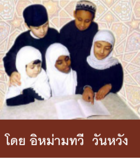
โดย อิหม่ามทวิ วันหวัง

การถือศีล-อดด้วยความศรัทธา เพื่อหวังความโปรดปรานจากอัลเลาะห์ จะช่วยเพิ่มความยำเกรง ขจัดอารมณ์ใฝ่ต่ำ และจะได้รับการอภัยความผิดที่เคยได้กระทำความ