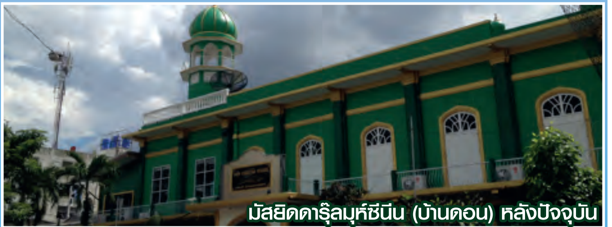
มัสยิดดาริลมุห์ซินีน (บ้านดอน) หลังปัจจุบัน

ในชุมชนดาริลมุห์ซินีน(บ้านดอน) มีศูนย์อบรมศาสนาอิสลามปละจริยธรรมประจำมัสยิด สอนอัลกุรอานและอิสลามศึกษาภาคบังคับ (ฟัรดูอัยน์) นอกจากนี้ ยังมีสถาบันสอนศาสนา ที่ผลิตบุคลากรรับใช้สังคมมุสลิมมากมาย นั่นคือ โรงเรียนมิฟตาฮ์อัลอูลูมิติตินียะห์ และยังมิโรงเรียนสุเหร่าบ้านดอนเป็นโรงเรียนสังกัดกรุงเทพมหานคร ที่ทำการสอนบุตรหลานของชุมชนสุเหร่าบ้านดอนในระดับประถมศึกษา และมีมัธยมศึกษาตอนต้น