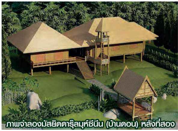
ภาพจำลองมัสยิดดาริลมุห์ซินีน (บ้านดอน) หลังที่สอง

เมื่อประมาณ 200 ปีล่วงมาแล้ว ชนมุสลิมกลุ่มหนึ่งจากภาคใต้ของประเทศไทย คือ จังหวัดปัตตานี ในสมัยต้นรัตนโกสินทร์ ได้มาตั้งภูมิลำเนาเป็นหมู่บ้านเล็กๆ อยู่ในบริเวณถนนสุขุมวิท ซอย 47 (ซอยบ้านดอน) ขณะนั้นบริเวณดังกล่าวเป็นที่ดอน จึงเรียกชื่อหมู่บ้านนี้ว่า “บ้านดอน” และยังไม่มัสยิดที่จะประกอบศาสนกิจ ต่อมาหมู่บ้านนี้(บ้านดอน) มีคนเพิ่มมากขึ้น ทำให้ความเป็นอยู่ได้รับความลำบากนานาประการ เนื่องจากหมู่บ้านนี้ตั้งอยู่บนที่ดอน การขาดแคลนน้ำและการคมนาคมเป็นปัญหาสำคัญยิ่ง จึงได้รวมกันย้ายหมู่บ้านมาอยู่ที่บ้านต้นไทร ริมคลองแสนแสบ เพราะเนื่องจากมีต้นไทรต้นหนึ่งคนทั่วไปจึงเรียกว่า “บ้านต้นไทร” แต่คนที่เข้ามาตั้งบ้านเรือนอยู่นั้น ได้ย้ายมาจากบ้านดอน จึงเรียกชื่อหมู่บ้านนี้ว่า “บ้านดอน” จนกระทั่งปัจจุบัน