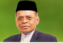
พศ.ดร. วิศรุต เลาะวาลี