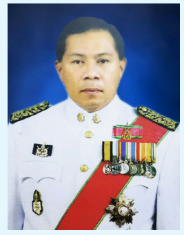
สมัย เจริญช่าง

ต่อมาในสมัยรัชกาลที่ 4 สยามมีการทำสนธิสัญญากับชาติตะวันตกมากขึ้น พระบาทสมเด็จพระจอมเกล้าเจ้าอยู่หัว จึงทรงมีพระราชดำริว่า สยามจำเป็นต้องมีธงชาติ ใช้ตามธรรมเนียมของชาติตะวันตก จึงทรง