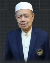
กองคำ มะกะมัด อัลลอฮ์ยอร์อัน